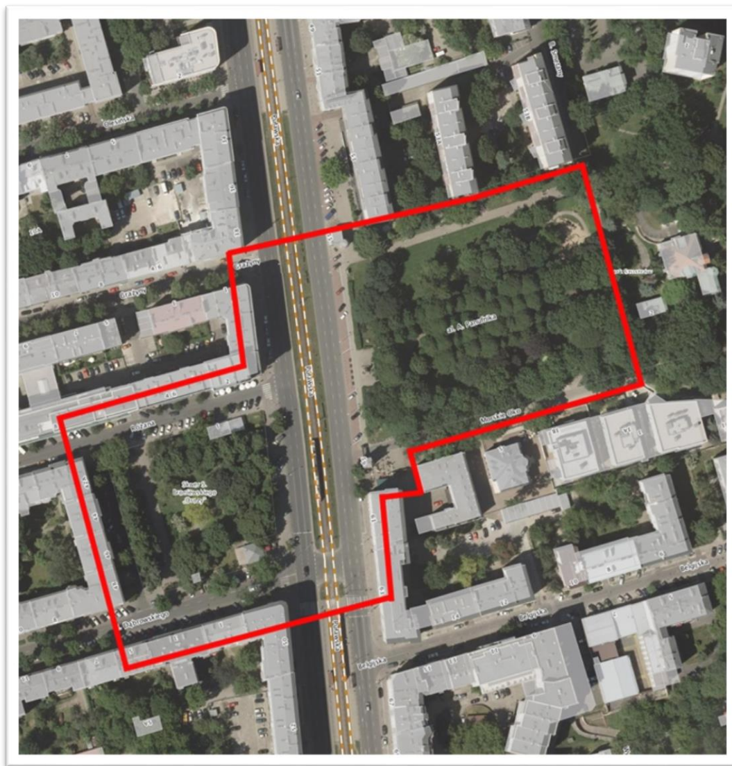
Zdjęcie 1 Obszar przyszłego Centrum Lokalnego

Twórcy idei Centrów Lokalnych definiują je jako miejsca przyjazne i niedległe, gdzie można się spotkać, spędzić ciekawie czas, zrobić zakupy. Łączą ludzi, budują lokalną wspólnotę. Na Mokotowie jako przyszłe CL został wybrany obszar obejmujący Skwer Stanisława Broniewskiego „Orszy” oraz park przed Pałacem Szustra.