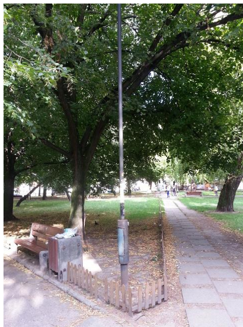
Zdjęcie 6 Pełny kosze i opadłe liście na skwerze

Dla przyszłego Centrum Lokalnego ważne są nie tylko inwestycje w zieleni czy infrastrukturę, ale także, a może przede wszystkim, bieżące dbanie o tę przestrzeń, w tym w szczególności zapewnienie czystości (57 wskazań, 13% głosów). Przepelnione kosze na śmieci czy niezgrabione liście przeszkadzają mieszkańcom. Dla zilustrowania wybraliśmy jedną z łagodniejszych wypowiedzi na ten temat: „ skwer jest piękny, stary, ale mocno zaniedbany ”, oraz „ sprzątać śmieci! szczególnie po weekendzie jest dramat ”. Niektórzy uczestnicy konsultacji sygnalizują problem dużych kontenerów na śmieci, użytkowanych przez lokale gastronomiczne i okolicznych mieszkańców, które pozostawiane na stałe na chodnikach przez ekipy sprzątające czy gospodarzy domów, psują widok, utrudniają ruch pieszki i parkowanie oraz zwyczajnie śmierdzą.