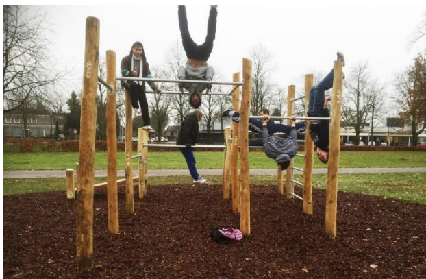
Zdjęcie 7 Przykład placu do kalisteniki

Trzecią oczekiwaną funkcją CL jest zapewnienie przestrzeni do sportu, szeroko rozumianej aktywności fizycznej (17 wskazań, 4% głosów). W tej grupie pojawiają się pomysły takie jak: stół do ping-ponga, miejsce do gry w boule wraz z wypożyczalnią kul, siłownia zewnętrzna, wpisany w krajobraz plac do kalisteniki, czy cymbergaja. Odrębnym acz zbliżonym głosem jest zapewnienie stołów do gier planszowych i towarzyskich - szachy lub piłkarzyki (12 wskazań, 3% głosów). Odnotowano także postulat utworzenia „małpiego gaju dla dorosłych” oraz zaprojektowania szachów plenerowych. Uczestnicy konsultacji wskazywali przestrzeń przed Pałacym Szustra jako potencjalny obszar aktywności o charakterze sportowym, zaś stoliki do gier mogłyby być ustawione na skwerze „Orszy”. Warto podkreślić, że idea aktywności sportowych pojawia się w kontekście zapewnienia atrakcyjności CL różnym grupom wiekowym, w tym młodzieży: „siłownia lub otwarty plac zabaw dla młodzieży, która nie ma swojego miejsca, np. stół do ping-ponga, cymbergaja, piłkarzyki”.