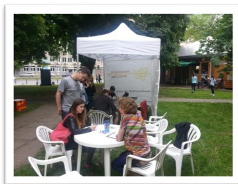
Zdjęcie 2 Namiot konsultacyjny

18 czerwca (sobota) na święcie „Mokotówka”