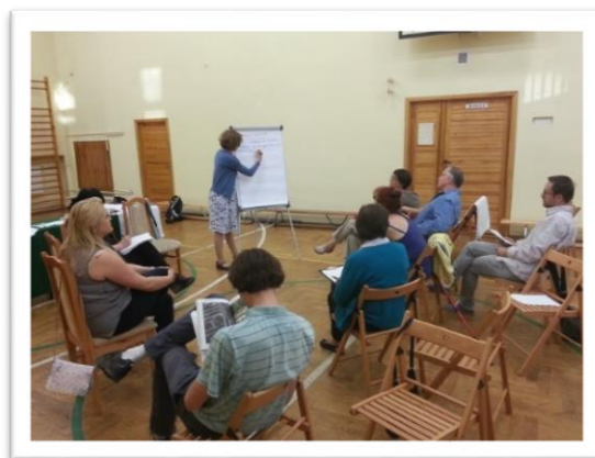
Zdjęcie 3 Warsztaty dla mieszkańców

Adama Mickiewicza, ul. Kazimierzowska 16