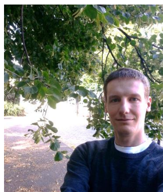
Zdjęcie 5 Gałęzie utrudniające wejście na Skwer