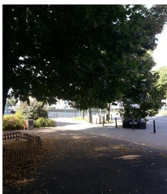
Zdjęcie 4 Nadmierne zacienienie Skweru

Częstym postulatem jest zachowanie obecnego drzewostanu (80 opinii, 19% głosów). Podsumowaniem niech będą dwa stwierdzenia wpisane na ulotkach konsultacyjnych: "Proszę nie robić jakiś drastycznych zmian, ponieważ ludzie związani z tą okolicą kochają ten Skwer za samą jego obecność i za jego zadrzewienie - takie małe osiedlowe płuca" oraz „Cokolwiek miałoby to być - BŁAGAM! NIE WYCINAJCIE DRZEW!!!" . W tym kontekście warto podkreślić, że mieszkańcy liczą na wpisywanie w przyrodę lokali gastronomicznych na skwerze. Ich zdaniem wszelkie podejmowane działania muszą zachować obecny drzewostan. Sygnalizowaną kwestią jest także sposób dbania o drzewa. Pojawiały się sugestie (7 opinii, 2% głosów), że na Skwerze „Orszy” niektóre drzewa wymagają prześwietlenia lub przycięcia zbyt nisko wiszących gałęzi. Pielęgnacja drzew powinna mieć jednak umiarkowany zakres, ponieważ mieszkańcy cenią sobie „drzewa dające cień”.