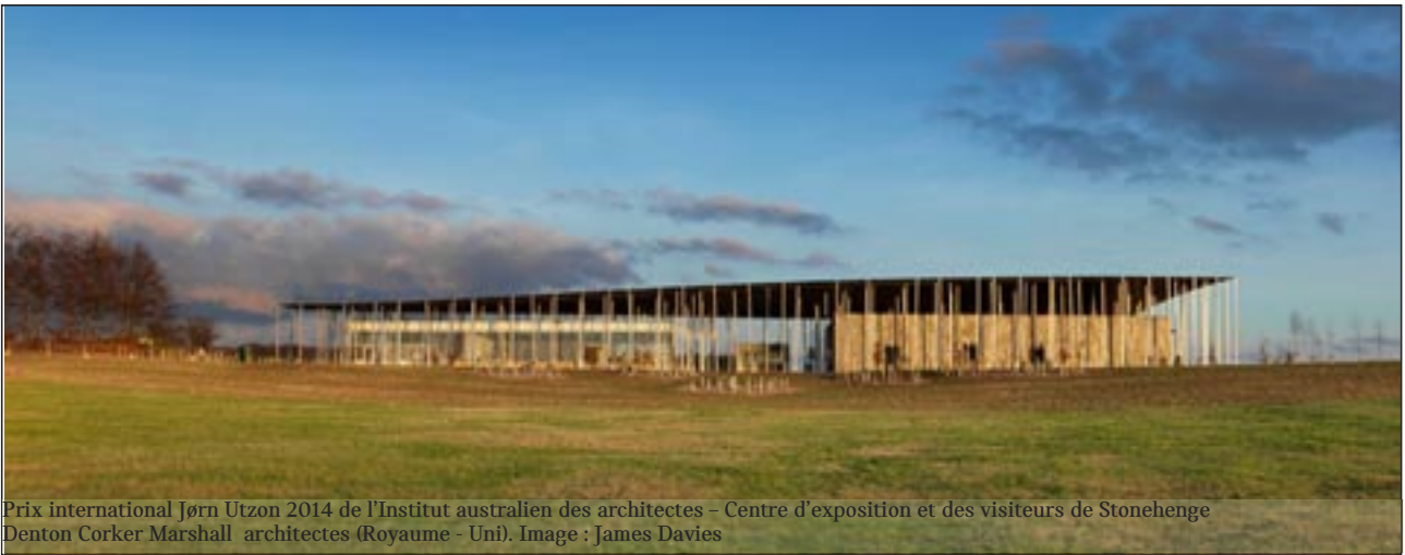
Prix international Jørn Utzon 2014 de l'Institut australien des architectes - Centre d'exposition et des visiteurs de Stonehenge Denton Corker Marshall architectes (Royaume - Uni).